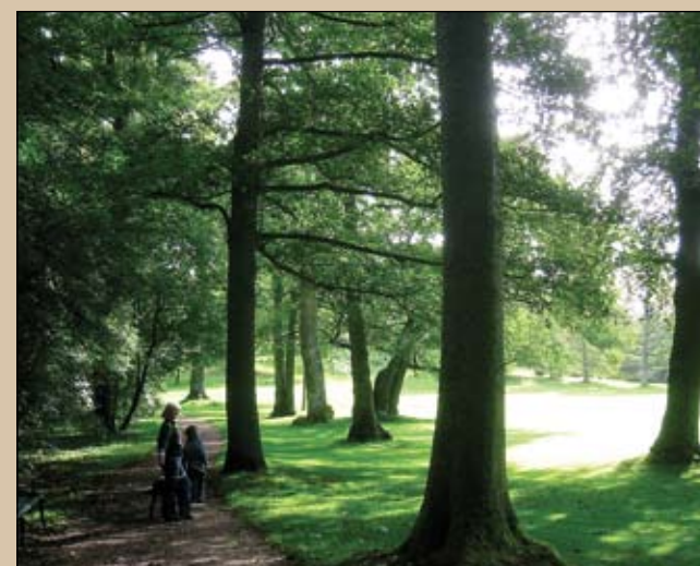
Gamle solitære træer i parkens græsområde.