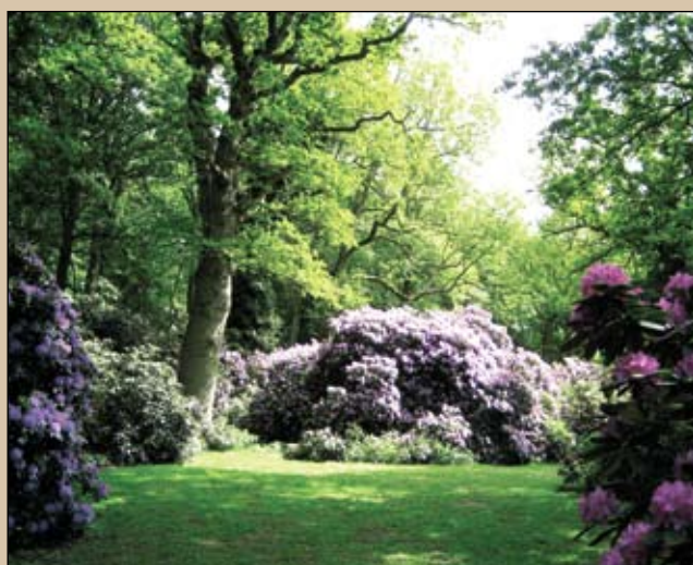
Rododendron under nogle gamle ege i maj.